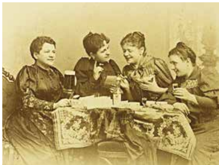
Skupinový portrét hereček Volfové, Foerstrové, Kvapilové a Kavalírové. nedatováno.