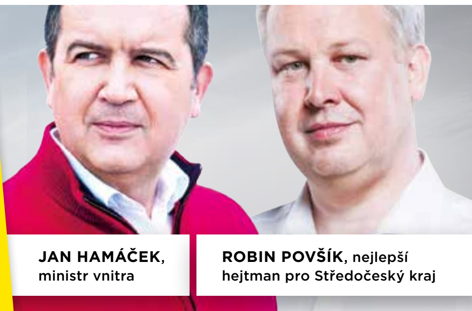
JAN HAMÁČEK, ministr vnitra