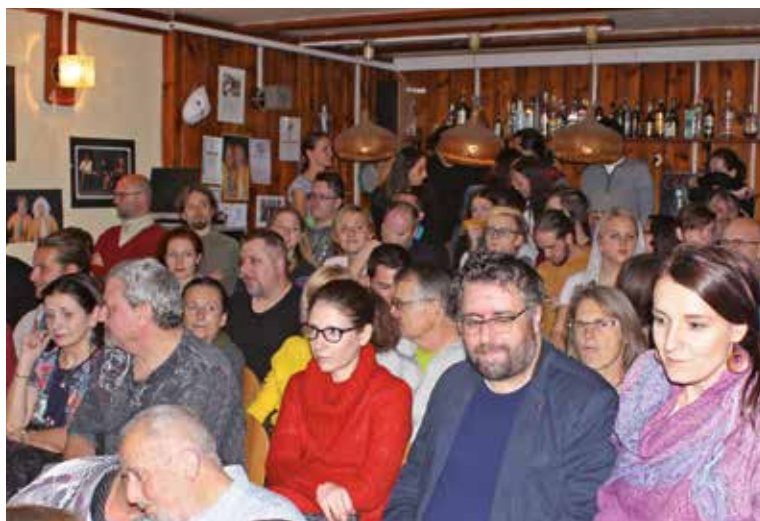
Záběry z premiérového představení kralupského divadelního souboru Scéna - konverzační jednoaktovky „Central Park West“.