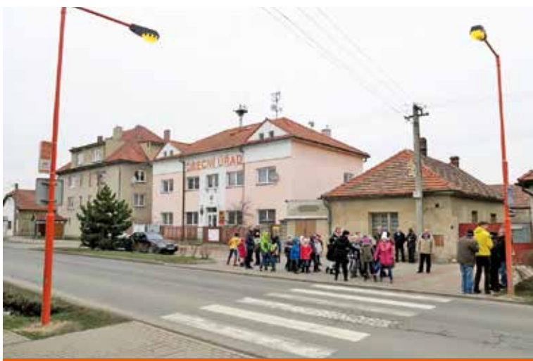
Nový bezpečný přechod v Chlumíně