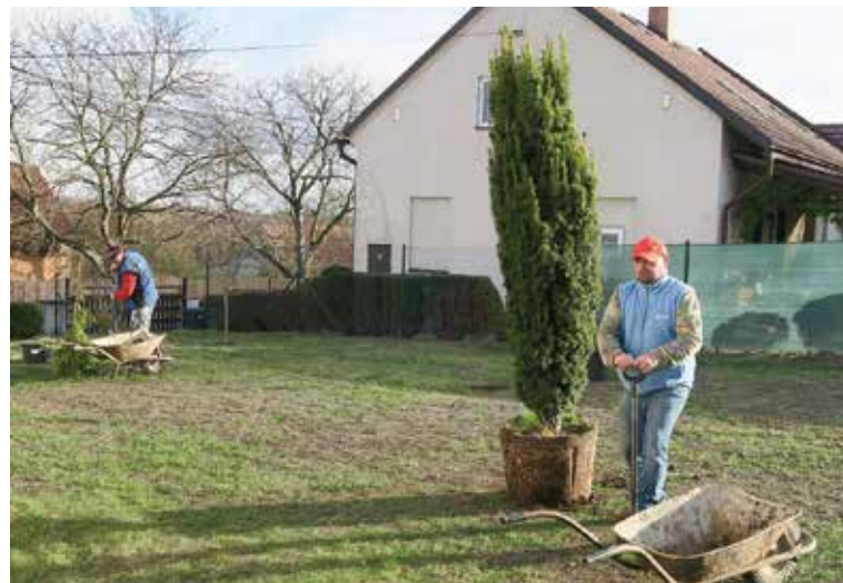
Výsadbu nových stromů, podpořenou grantem Nadace ČEZ v obci Kanina na Mělnicku

Nadaci ČEZ založila energetická společnost ČEZ v roce 2002, aby zastřešila svou dárcovskou činnost. Nadace ČEZ podporuje několika grantovými programy sociální, kulturní a sportovní projekty a aktivně spolupracuje s regiony. Výši rozdělených příspěvků se řadí ke špičce nadací v České republice. Více informací na www.nadacecez.cz