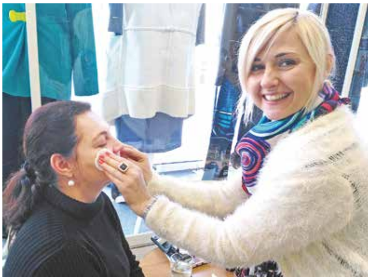
MODERNÍ PROVOZ SKÝTÁ prostor pro pořádání nejrůznějších projektů. Snímek z předvádění správného líčení.

entek stále není věnována potřebná pozornost a obchody na ně příliš nehledí a nenabízejí takovou rozmanitost, jakou by si zasloužily. U nás si však mohou vybrat ze široké škály nadměrných velikostí až do 7 XL. Prodáváme například podprsenky společnosti Timo a zákaznice si mohou přijít vyzkoušet prádlo velkých obvodů i velikostí. Samozřejmostí je bezplatné poradenství při výběru správné velikosti. Zanedlouho nabídneme podprsenky velikosti L a M od stejné firmy. Nesmím opomenout ani Ateliér Donát, v jehož spolupráci jsme pro tyto klientky uspořádali módní přehlídku.“