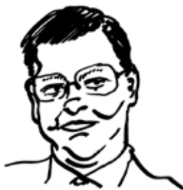
„Naši nízkou porodnost částečně vyřeší imigranti!“ Pavel Bělobrádek, 2015