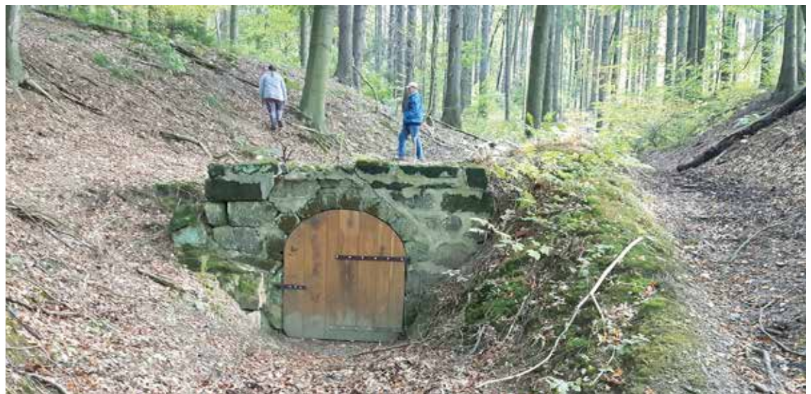
STUDÁNKA NAD PRAMENEM PŠOVKY

Výlet k těmto místním zdrojům připravili členové spolku Voda Jelenice.