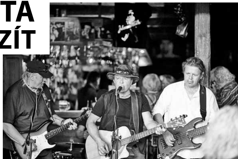
Se svojí kapelou bývá pravidelným hostem letních Blues před Dírou.

se. Neustále vytrhování... Na bolest je člověk vždycky sám... Dohraješ, vylezeš ven a nad tebou nekonečné nebe, možná padá hvězda... Teď to jenom vydržet, to chlastání, hulení, houpání lustrů v Díře, jako před