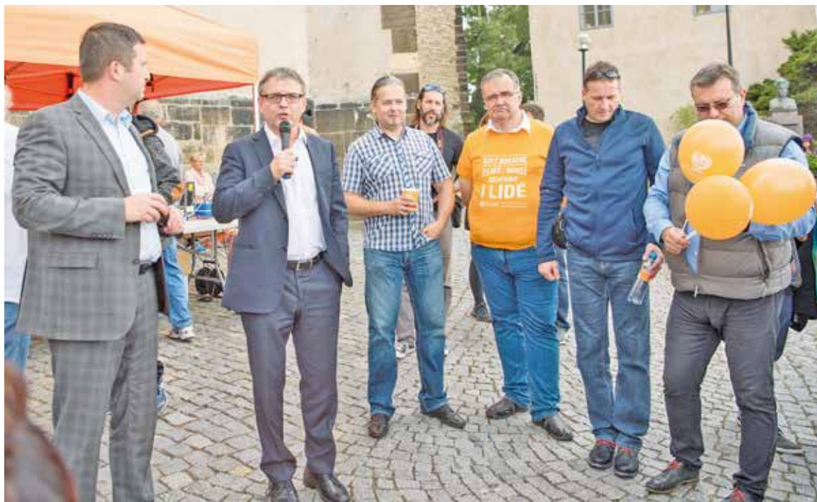
Na okřídlené krasavce se do Mělníka přijel podívat i ministr zahraničí Lubomír Zaorálek (ČSSD).