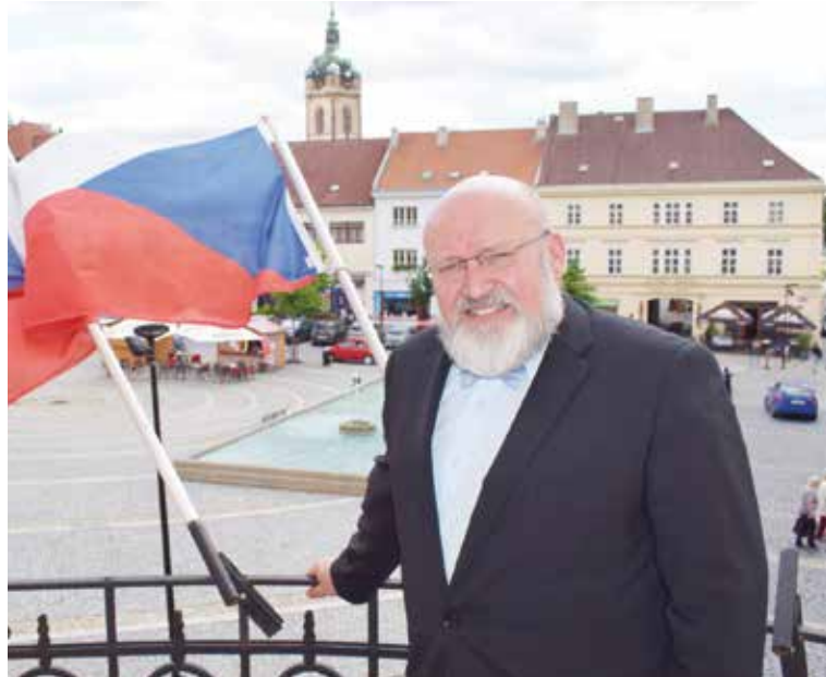
MVDr. Ctirad Mikeš, starosta Mělníka