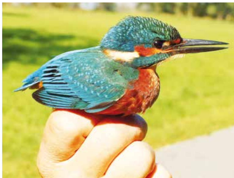
Při ukázce kroužkování vzbudili největší pozornost odchytení ledňáčky říční.

Druhý ročník Festivalu ptactva ve veltruském zámeckém parku, který se konal o den později, v neděli 1. října, navštívilo 15 zájemců, z toho 4 děti. Pozorováno bylo 35 druhů ptáků, mimo jiné například kormorán velký, strakapoud a datel.