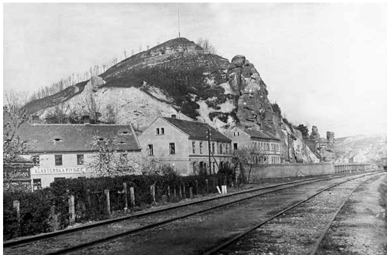
KRALUPSKÝ HOSTIBEJK V ROCE 1902.

Přibližně po vrstevnici se vine pod vrcholem Hostibejku stezka na mapách označená jako „Svojsíkova cesta“ na paměť zakladatele skautingu v Čechách Antonína Svojsíka. Cesta je na nejvyšším místě zakončena půvabným vyhlídkovým altánkem, z kterého je krásný výhled na podřipskou krajinu. Jméno tohoto bizarního vrchu, který by mohl být klidně ve znaku Kralup, se dostalo do podvědomí většího počtu lidí již v roce 1869, kdy známý pražský ča-