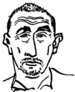
„Všetci kradnú!“ Andrej Babiš 2014